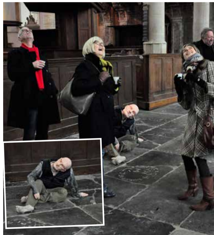
* Kerkgangers oog in oog met de Rietveldtentoonstelling in de Oude Kerk.

Dat gebeurt ook bij de jaarlijks terugkerende expositie van Rietveldstudenten in de Oude Kerk. Die heeft bovendien als voordeel dat je de makers van het werk kunt ontmoeten. Die raken meer en meer betrokken bij de kerkdienst waarin we tijdens de expositie aandacht aan hun werk besteden. Afgelopen jaar heb ik met een van hen samen geprekeerd. En bij het aansluitende forum over kunst en religie meldde ze opgewekt, dat ze onze dienst net