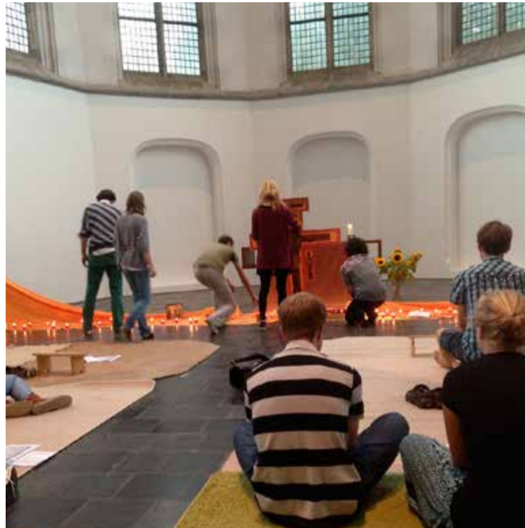
* De Taizéviering in de Janskerk tijdens de UITweek viel in de smaak. Zo'n 40 tot 45 mensen kozen voor een moment van rust en bezinning in het midden van een hectische week.

Als vanouds gebeurt dat met een bont scala van activiteiten, maar toch is er wel iets veranderd. Meer dan voorheen wil de PGU namelijk haar verantwoordelijkheid voor dat studentenpastoraat waarmaken en verbindingen leggen tussen gemeenten en groepen die er iets mee van doen hebben. Daartoe is onlangs een werkgroep gevormd rond studentenpredikant ds Jasja Nottelman, met vertegenwoordigers van diverse wijkgemeenten. Die werkgroep gaat plannen voor de toekomst ontwikkelen en acti-