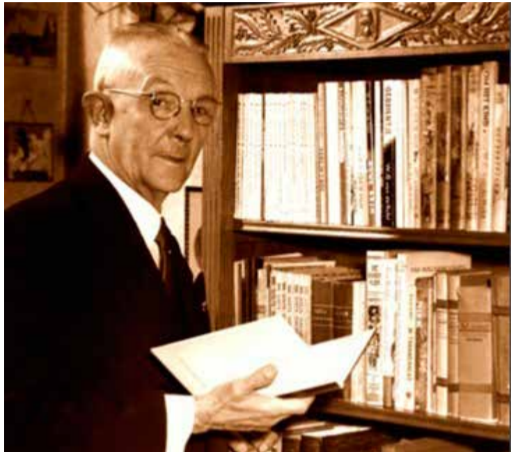
*W.G. van de Hulst, de beroemd geworden meesterverteller.

Op 1 oktober is er 's avonds in de W.G. van de Hulstschool een presentatie over Willem Gerrit van de Hulst, de 'bovenmeester' van de school aan de Jutfaseweg.