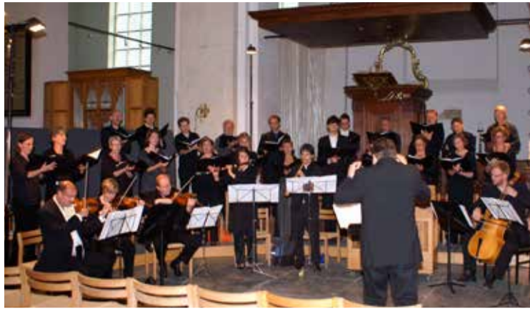
* De Cappella di San Nicolai samen met de vespercantorij tijdens een vesper.