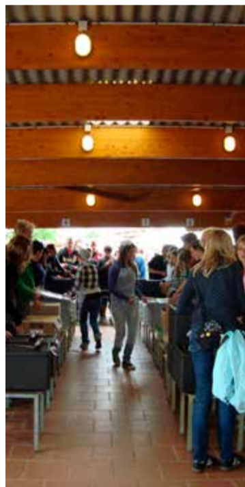
* De wachtrij voor het eten in Taizé.

theologische uitgeverij Narratio®, Gorinchem www.narratio.nl