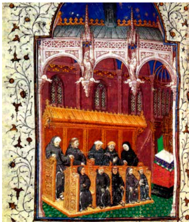
* Kanunniken: terug van weggeweest...

Om de traditie voort te zetten en om de actuele betekenis van de getijdendiensten te laten voortgaan is Citypastoraat Domkerk nu op zoek naar eigentijdse kanunniken. Het inspirerende voorbeeld van de kanunniken willen we vertalen naar een nieuwe vorm. Dit betekent dat kanunniken op geregelde tijden aanwezig zijn bij de gebeden. Naast dat de aanwezigheid bij de gebeden op zich al een weldaad