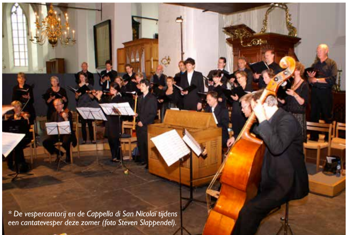
* De vespercantorij en de Cappella di San Nicolai tijdens een cantatevesper deze zomer.

De doorgaande lezingen in de vespers dit jaar beginnen met 1 Petrus. Bij bijzondere vespers, zoals de cantatevespers en de vespers bij de feestdagen,